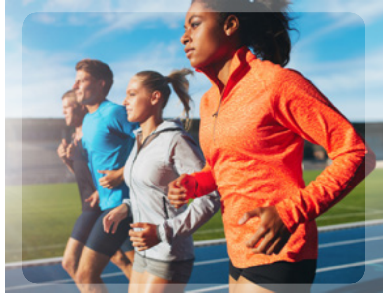
Sukupuolistereotyyppien kitkeminen on ehdoton edellytys sukupuolten tasa-arvon vahvistamiselle urheilussa ja päätöksenteossa

EIGEn tutkimuksessa on havaittu, että urheilualan päätöksenteon muutosten laajuutta on vaikea mitata, koska EU:n tasolla ei ole sopivia indikaattoreita.